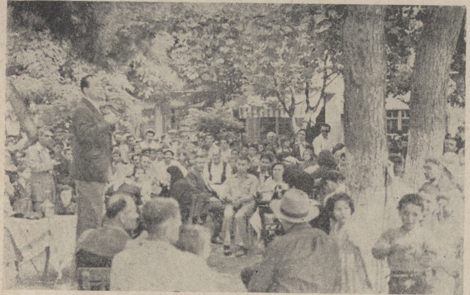
Gündüz Akbıyık köylülerle başbaşa