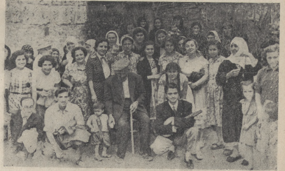
Yeşilaycılar Ereğli'li kadınlar arasında