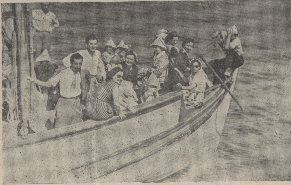
Motör, Yeşilaycılarını Ereğli'ye götürürken

Köyün çok eskiden beri geçirdiği tarihî ve iktisâdî olaylarına, Sağlık ve Sosyal bahislere ait hususî ve umumî yapılan hasbihaller köyü daha yakındantandırmak maksadiyle tertiplenen köy-içigezileri