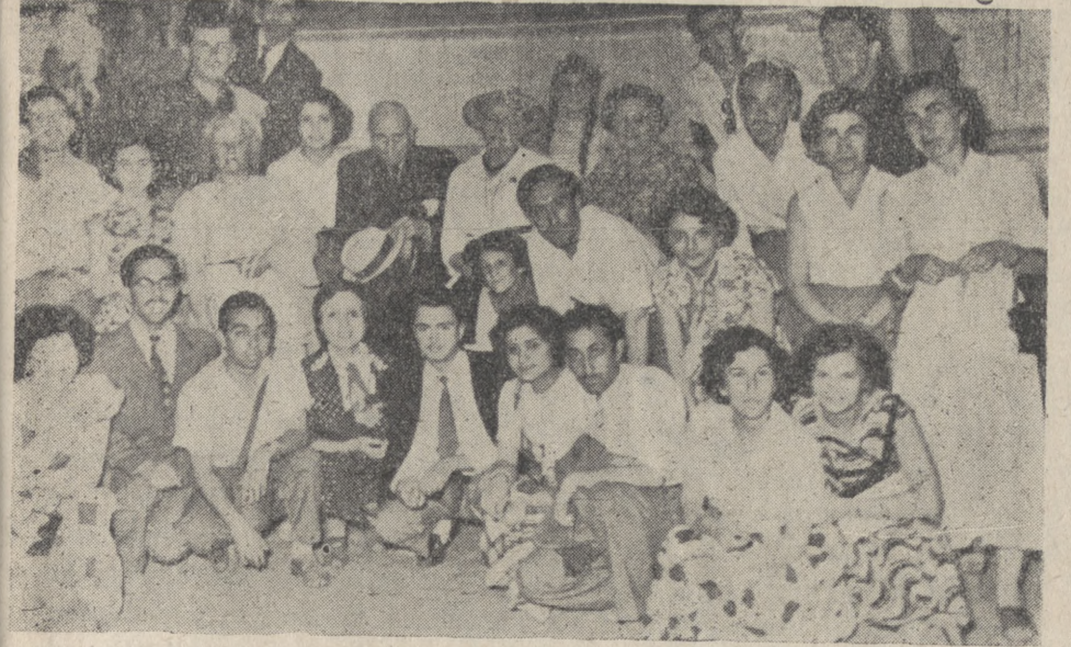
Yeşilaycılar Hereke Halı Fabrikasında