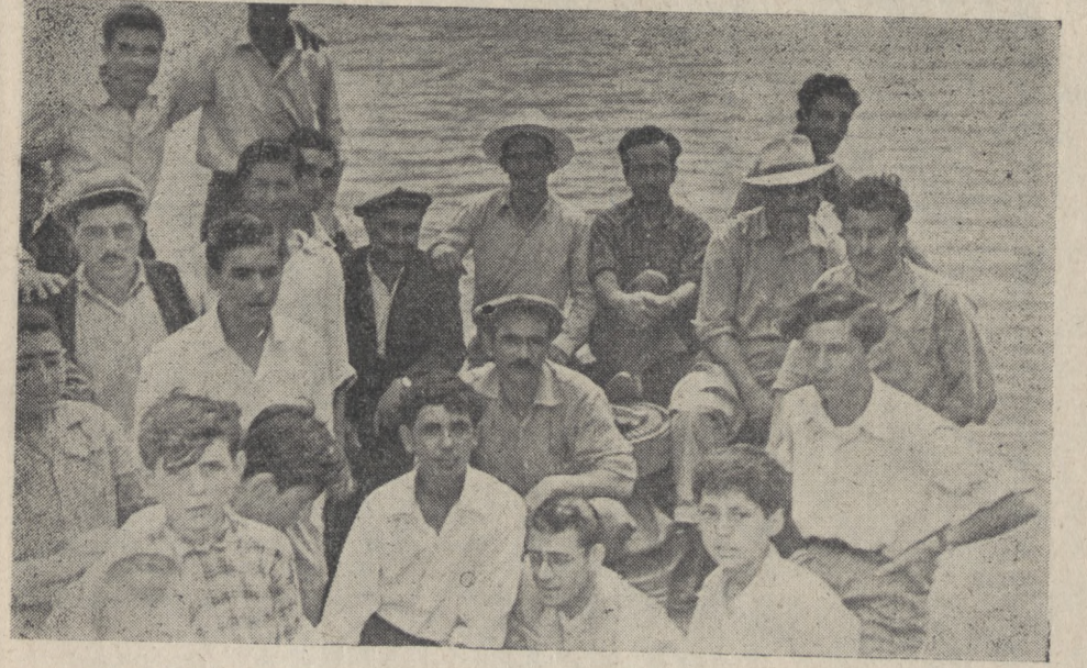
Ereğli'li gençler motörlerinde