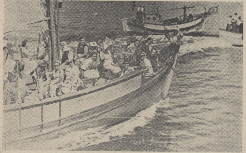
Yeşilaycular Ereğlîlilerin motörleri refakatinde